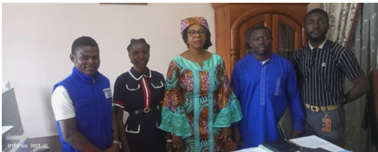
Partnership agreement with the University of Yaoundé 1