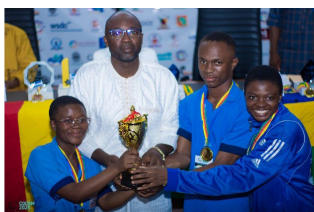
Best moments- COCAM 2025