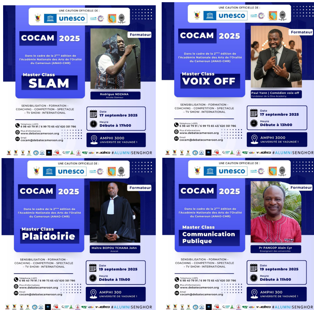
Figure 5: Master Class posters.