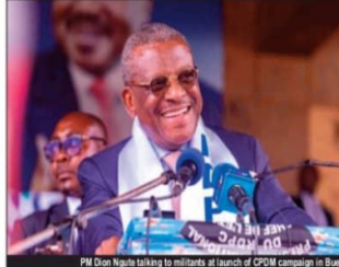
PM Dion Ngute talking to militants at launch of CPDM campaign in Buea