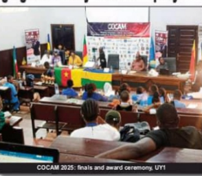
COCAM 2025: finals and award ceremony, UY1

The Cameroon National Oral Communication and Debate Competition, COCAM, 2025 has emphasized that a people without knowledge of their history and culture are "like a tree without roots." The event was organized on 20 September by the National Academy of Arts and Sciences (NACS), in collaboration with the International Center for Research and Documentation on African Traditions and Languages (ICRDTAL), at the University of Yaoundé I. Held under the auspices of the Ministry of Youth, Sports and Civil Education, MINES, the competition brought together young participants from the North-West, North, South-West, and Centre regions. The event aimed not only to select winners in categories including public speaking, debate, short story, storytelling, and slam poetry, but also to identify and nurture young talents for future national and international competitions. The organizers emphasized their inclusive approach, stating, "We celebrate greatness in minority and greatness in greatness," while highlighting the institution's openness to all Cameroonian and foreign participants committed to valuing languages, cultures, and traditions. The competition attracted international participation, notably from French-born Dr. Ntini Debat, who was invited as a special guest to the event by African Advanced Development in these arts for us.