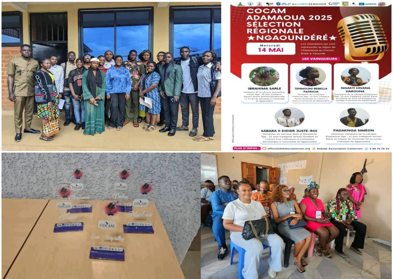
Figure 3 Illustration of some Regional Selections

Only after these various stages of the competition are the representatives of each region determined. These regional competitions took place in all regions of Cameroon.