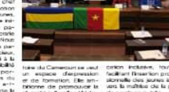
Ouverture des rideaux de la Coupe Oratoire du Cameroun.