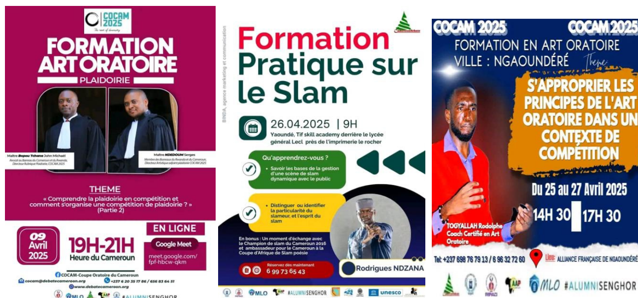
Figure 2 : Presentation of some posters for the training programs

Following the aforementioned steps, candidates receive training in their respective regions, both online and in person, covering the various categories, the rules of the game, and the values of our partners in relation to the overall theme of the competition. These training sessions took place in all regions of the country and were led by experienced trainers with proven track records, covering all categories. This hybrid model was chosen to allow as many candidates and all interested individuals as possible to participate and receive training to prepare themselves for the competition itself.