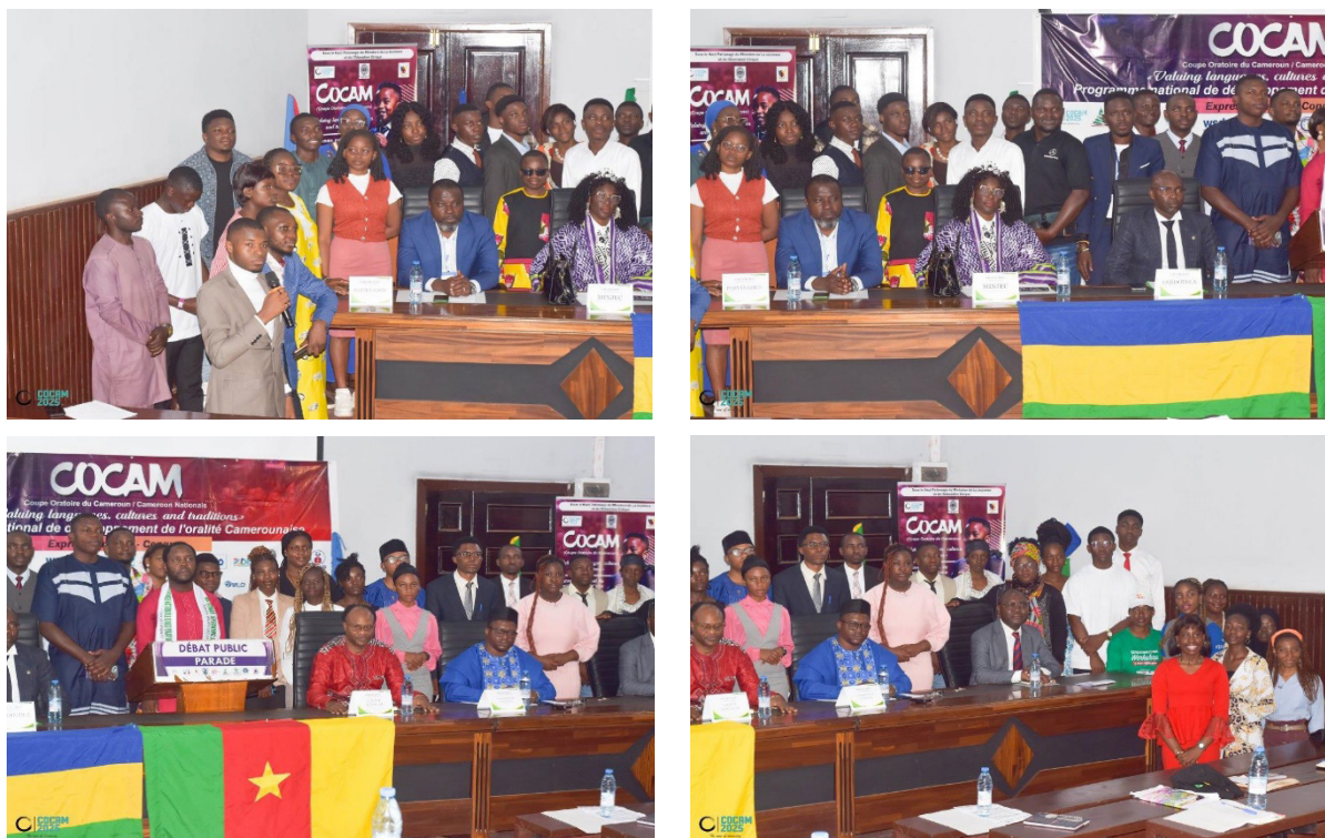
Figure 4 : Overall images Opening ceremony (Wed. 17/09/25, Amphitheater 300 U.Y.I)

Participants received refresher training on the competition rules, objectives, and various stages; in addition, they benefited from intensive training sessions until Saturday, September 20th.