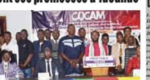
Le Cocam 2025 tient ses promesses à Yaoundé.

La Coupe nationale d'oratoire du Cameroun est un projet structurant de développement de l'oralité camerounaise qui vise à promouvoir l'éloquence, la culture et les compétences en communication chez les jeunes camerounais.